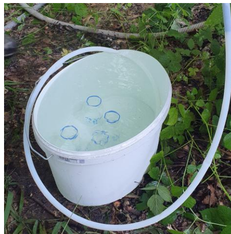
Abbildung 1: Probenahme unter Wasser (allgemeines Beispiel)

* Bei der Probenahme unter Wasser wird ein größeres Gefäß, z. B. ein Eimer, mit gefördertem Grundwasser gut gefüllt. Anschließend wird das geöffnete Probengefäß vollständig unter Wasser in den Eimer gestellt, während weiter Grundwasser über den Schlauch in den Eimer strömt ( Abbildung 1 ). Zum Abfüllen einer Probe wird der Probenahmeschlauch in das Probengefäß bis zum Gefäßboden geführt und auf diese Weise das Wasser in dem Gefäß mehrfach ausgetauscht. Vor dem Verschließen des Gefäßes ist darauf zu achten, dass der Deckel/Stopfen zuerst ins Wasser außerhalb des Probengefäßes getaucht und so gedreht wird, dass ggf. vorhandene Luftblasen aus Einbuchtungen im Deckel/Stopfen entweichen können. Anschließend wird das Gefäß unter Wasser mit dem Deckel/Stopfen verschlossen. Somit wird jeglicher Kontakt zur Umgebungsluft vermieden