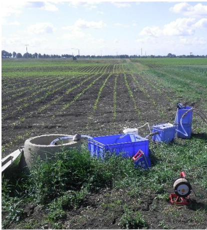
Abbildung 1: Eine Grundwassermessstelle während der Beprobung zur Feststellung der Nitratkonzentration und des abgebauten Nitrats

„Die Nitratkonzentration im Grundwasser wäre gebietsweise noch höher, wenn ein Teil des eingetragenen Nitrats nicht durch Denitrifikation abgebaut werden würde.“