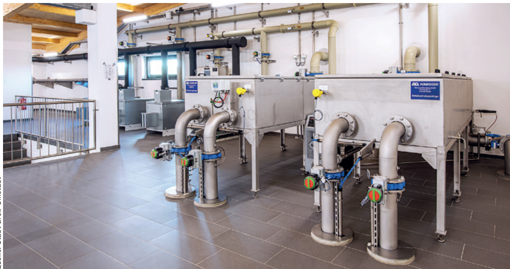
Abb. 4: Entsäuerung durch Flachbettbelüfter