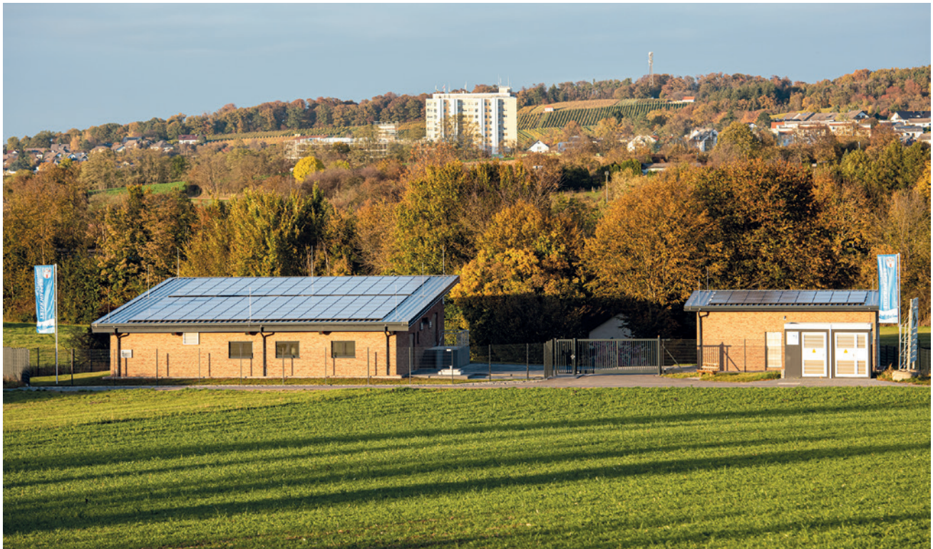
Abb. 2: Außenansicht des Wasserwerks in Groß-Umstadt

wert der Trinkwasserverordnung von 50 mg/l weiterhin deutlich unterschritten wird. Für den Fall von einem noch extremeren Anstieg der Nitratkonzentration in mehreren Brunnenwässern wurde planerisch die Nachrüstung einer dritten Straße vorgesehen. In einem solchen Fall würde praktisch eine Vollstrombehandlung des Rohwassers erfolgen. Daher wurde ebenfalls eine Teilstromaufhärtung des Permeats, bestehend aus einer Kalkfilterstufe mit Kalksilo einschließlich CO 2 -Dosierung, planerisch vorgesehen.