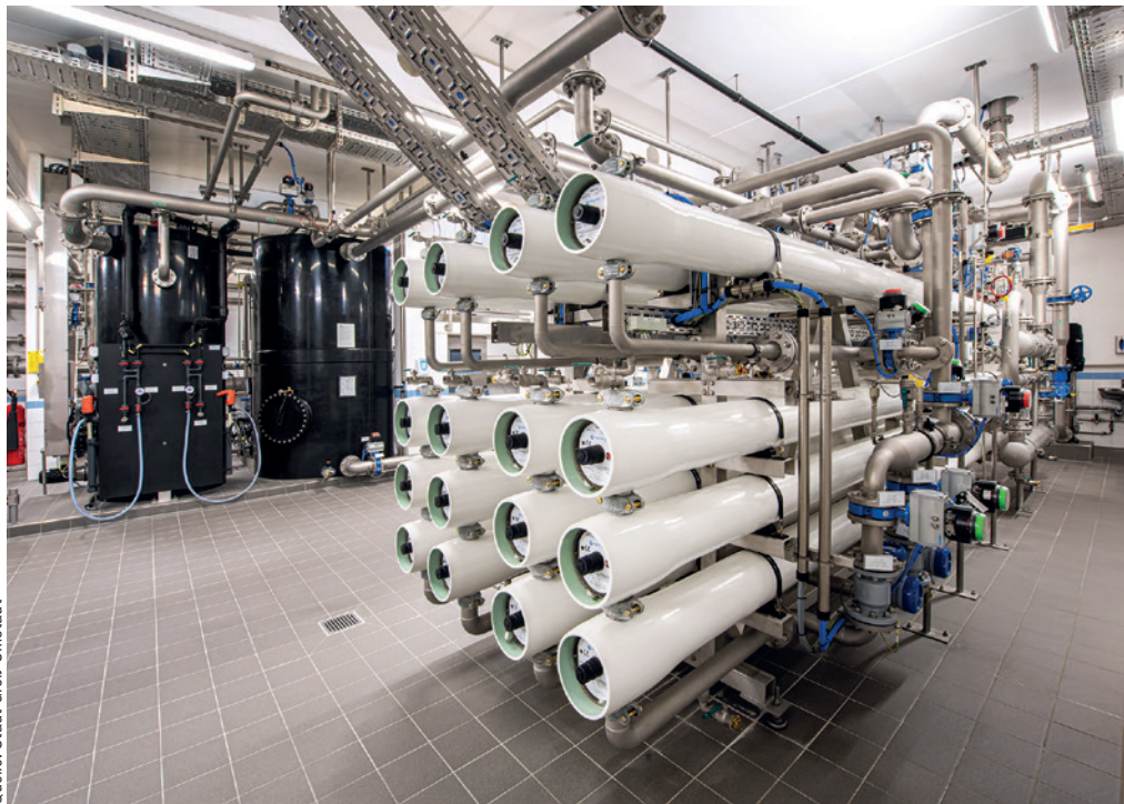
Abb. 3: Kompakt angeordnete zweistraßige Umkehrosmoseanlage

Die Anlage ist am 1. Oktober 2021 in Betrieb gegangen und verfügt zum ▶