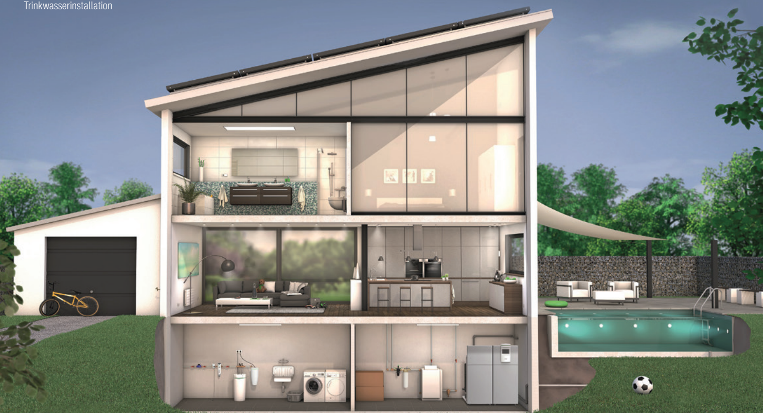
Abb. 1: Einsatz von Enthärtungsanlagen in der Trinkwasserinstallation